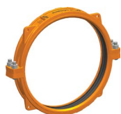
Diamètres 26 – 60"/ DN650 – DN1500 Breveté