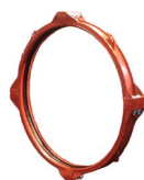
Diamètres 62 – 78"/ DN1550 – DN1950 Breveté