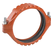
Diamètres 14 – 24"/ DN350 – DN600 Breveté