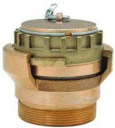
Raccord d'alimentation mâle