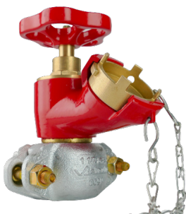
Robinet de prise simple avec collier Victaulic