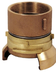
Demi-raccord symétrique femelle avec ou sans verrou