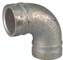
Coude rainuré 90° et 45°