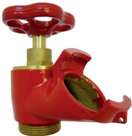
Robinet de prise simple fileté mâle volant et bouchon optionnels