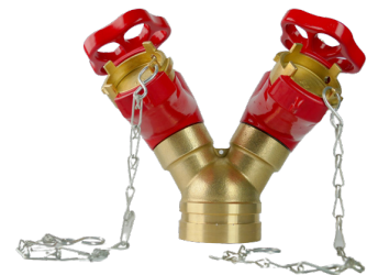
Robinet de prise double rainuré volant et bouchon optionnels