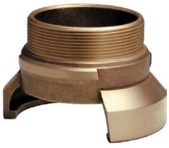
Demi-raccord symétrique mâle avec ou sans verrou