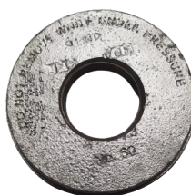
Bouchon rainuré avec taraudage