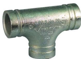
Té rainuré Té égal ou té réduit