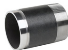
Manchette rainurée / filetée