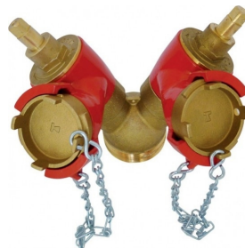
Robinet de prise double fileté mâle volant et bouchon optionnels