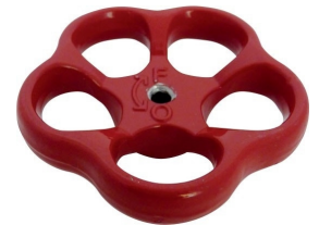
Volant pour tête carré 12mm