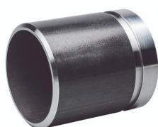
Manchette à rainurée / à souder