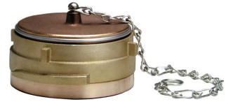
Bouchon avec verrou et chainettes